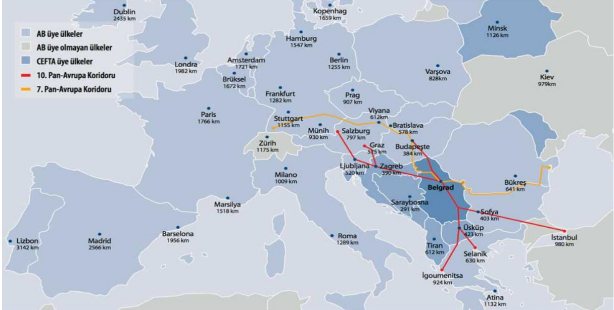
Resim 1. Sırbistan’ın Avrupa Bölgesinin Önemli Ulaşım Koridorlarındaki Pozisyonu

Sırbistan’ın bu avantajlı coğrafi konumuna ilaveten 1,3 milyar kişiye gümrüksüz erişim sağlayan ticaret anlaşmaları ağı, Sırbistan’ı yatırım açısından cazip bir hale getirmektedir. Ayrıca 2014 yılı başında Sırbistan’ın AB’ye üyelik müzakereleri başlamış olup bu kapsamda önemli yasal uyumlaştırmalar gerçekleştirilmiş ve gerçekleştirilmeye devam etmektedir. Sırbistan’da yatırım ortamı, AB müzakere süreciyle birlikte gelişmeye başlamıştır. Son dönemde Sırp Hükümeti de özellikle yabancı yatırımların ülkeye gelmesi konusunda çaba sergilemektedir. Ancak bürokrasi süreçlerinde öngörülemeyen durumlar ve gecikmeler yaşanabilmektedir.